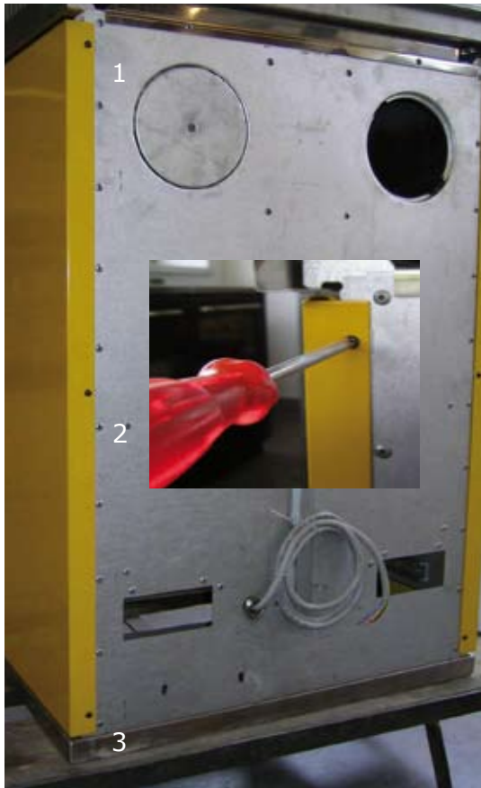
1. Dévisser les trois vis autotaraudeuses du bord externe