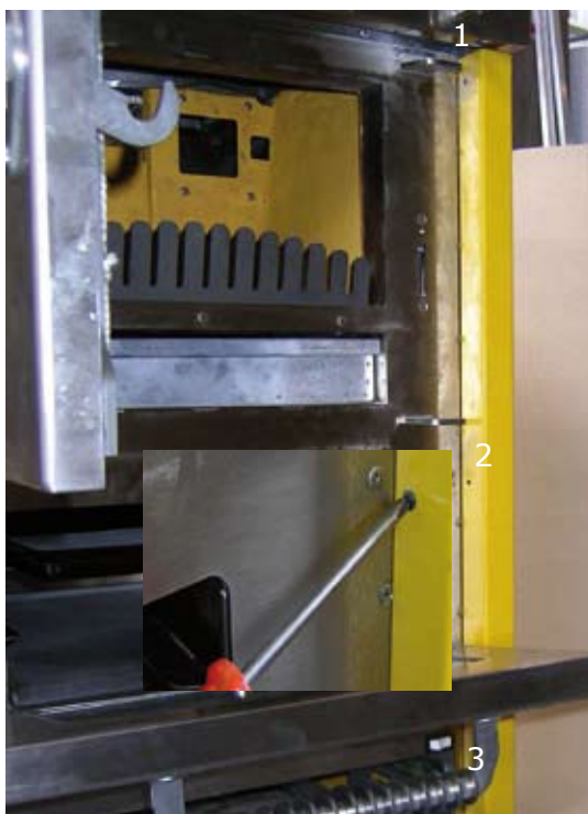
2. Dévisser les trois vis autotaraudeuses du bord interne