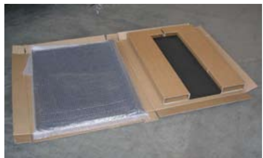
Emballage en carton à recycler