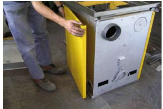
3. Commencer par derrière pour retirer la joue ; continuer lentement dans la rotation pour ne pas endommager la peinture

Note : pour accéder aux vis, veuillez ouvrir la porte de la chambre de combustion, ouvrir la porte du four et retirer le tiroir du bois, voir position 2